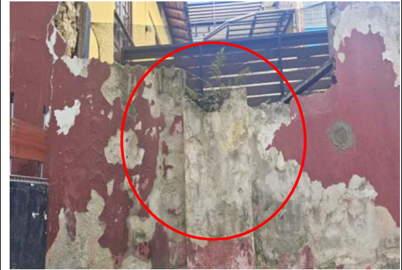
Imagen 3. Entre las patologías encontradas se tienen desprendimiento de elementos, machones en mampostería desplomadas y derruidas, pérdida de verticalidad, fisuras y agrietamientos en muros.