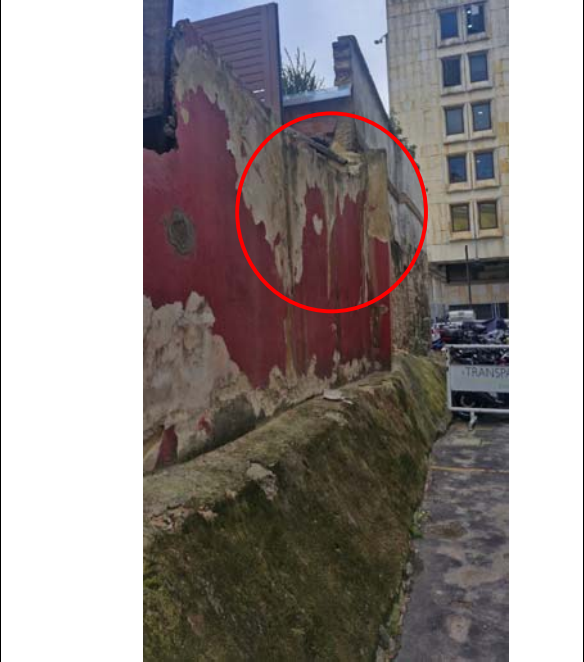
Imagen 1. Se evidencia que muro presenta una inclinación considerable representando riesgo de colapso. No se evidencian elementos de confinamiento en concreto. El cemento se encuentra en buenas condiciones