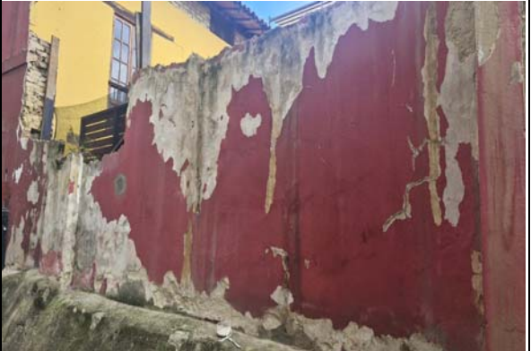
Imagen 4. Se evidencia que el muro no tiene algún tipo de protección contra la infiltración de aguas lluvia.