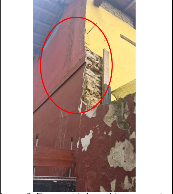
Imagen 2. El muro original en adobe se encuentra derruido casi en toda su altura el cual no se logra ver debido a que fue construido un muro en mampostería de arcilla simple pegado el cual también se encuentra con varias afectaciones.